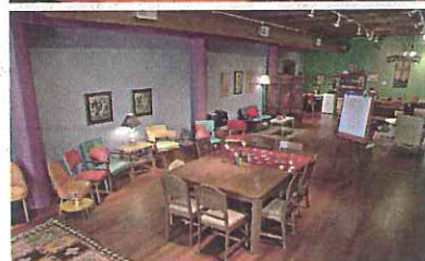
①②カタリスト・ランチの会議スペース。色とりどりの家具が備えられ、キッズルームと見まがうほど。会議室とは思えない雰囲気